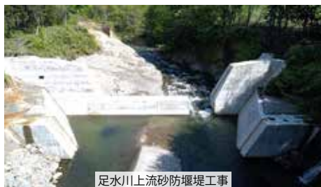
足水川上流砂防堰堤工事