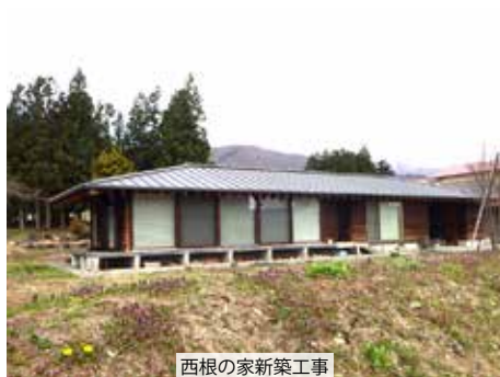
西根の家新築工事