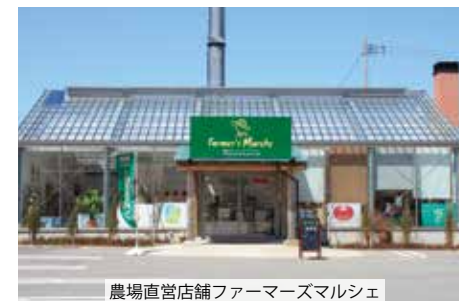
農場直営店舗ファーマーズマルシェ