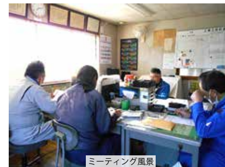
ミーティング風景