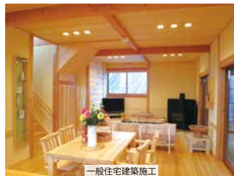
一般住宅建築施工